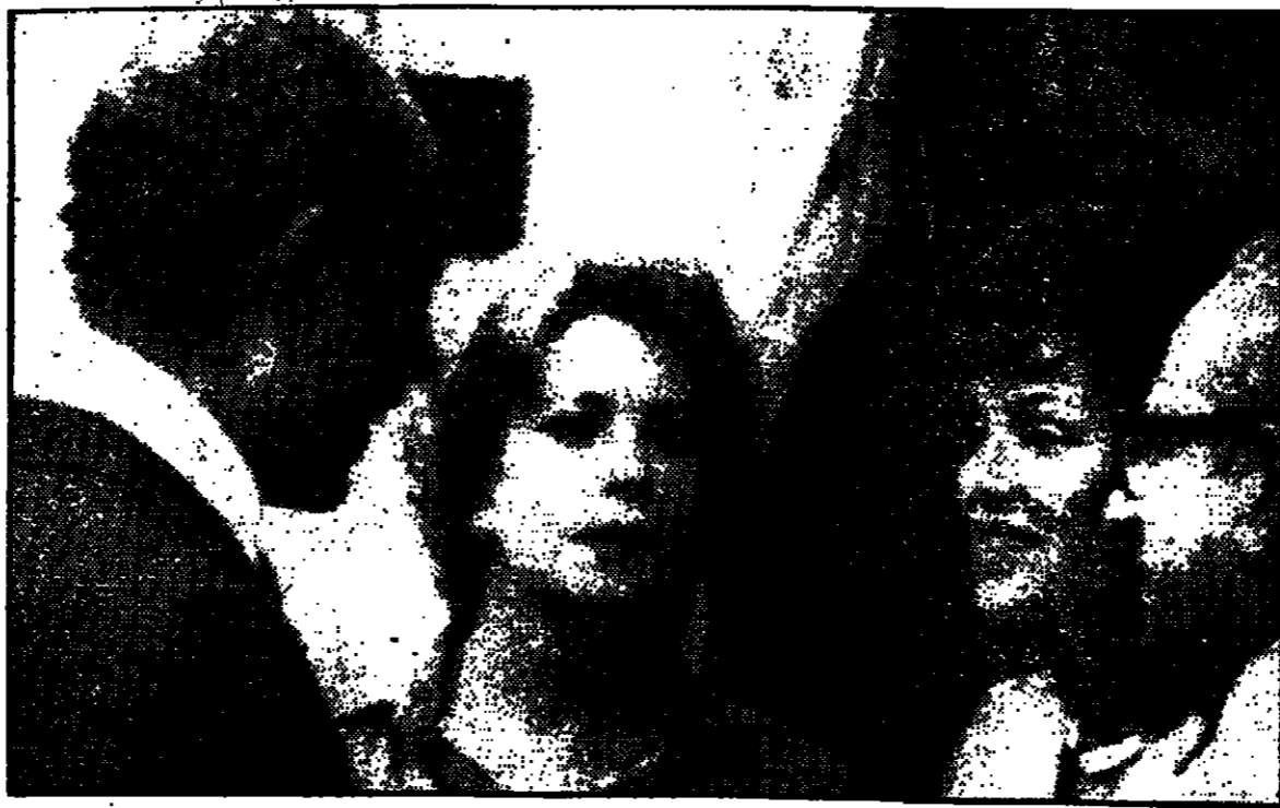
الرئيسان السادات وناسون وعقيلتهما في ميت ابو الكوم .